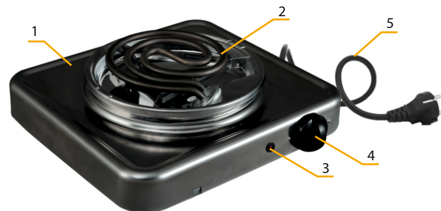
Рис 1. Устройство электроплитки

1. Корпус; 2. Нагревательный элемент; 3. Лампа световой индикации; 4. Регулятор мощности; 5. Шнур электропитания